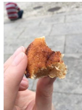
Sintraspecialitet som smakade kanelbulle. Det som hann fotas.