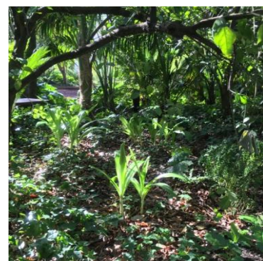
I början av februari. Omställning.