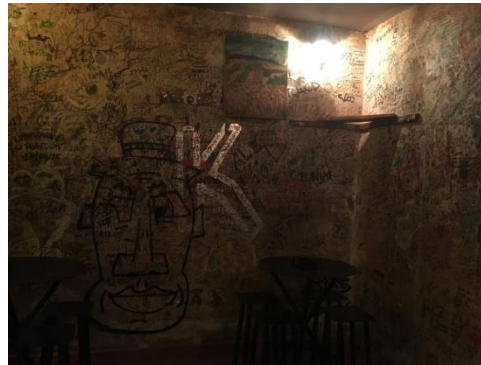
Inifrån mysig källarbar med grym sprit.

Rekommenderar att välja skaldjursrätter om du äter det, de var klockrena varje gång. Några av de ställen jag minns namnet på var