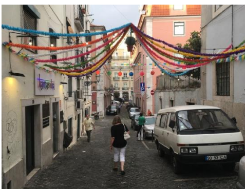
Morsan på besök.