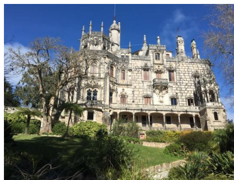
Quinta da Regaleira lär du besöka om du är larkare.