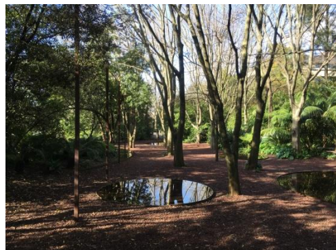
Larkkänsla i Jardim Gulbenkian – bonus.

Vad gällde tillgängligheten till tillrättlagad grönska och parker i staden var det ett önskemål men inte alls lika hög prio som möjligheten att åka på utflykter till frodiga, tillsynes orörda skogar med tropisk karaktär i anslutning till staden. Jag var lite inne på Madrid ett tag, men Lissabon vann valet mycket tack vare närheten till stränderna.