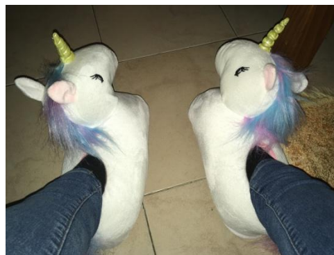
Kvickt införskaffade tofflor.

...önskar jag att jag hade haft med mig varmare kläder - inomhus var det nämligen snorkallt långt inpå försommaren. Den första veckan, innan jag lyckades köpa och smuggla in en värmefläkt i mitt korridorsrum, fick jag gå upp tre gånger per natt och fylla på flaskor och burkar med varmvatten som jag la under täcket för att kunna sova. En korridorspolare hade tidigare under vintern dragit på sig en permanent köldskada på foten för att det var så kallt inomhus. I skolans lokaler var det inte bättre, folk tog inte med sig jackor, mössor och halsdukar för tiden de spenderade utomhus utan för tiden de satt och huttrade i lektionssalarna.