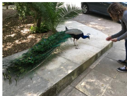
Påfågelhäng på campus.