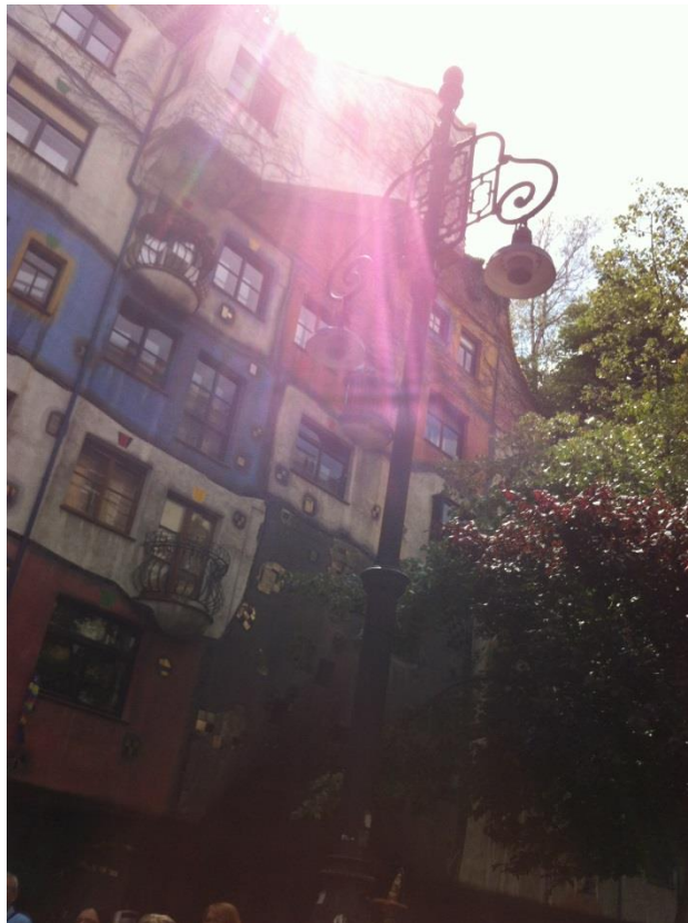
Hundertwasser låter naturen komma in i huset, en oas i storstan och en påminnelse om människans band till naturen. Glädjande och inspirerande och ett starkt intryck jag tar med mig från Wien!

Utbytet i Wien har utvecklat mig mycket. Bara att komma till ett annat land och bosätta sig där för ett tag är väldigt lärorikt. Det är så mycket som ska ordnas med – så mycket pappersarbete! Hela den byråkratiska delen var något helt nytt för mig och jag har lärt mig mycket på det, framförallt av mina många misstag... Ett tips till blivande utbytesstudenter är att fråga en gång extra om allt verkligen är fixat och var ute i god tid, det spar både tid och stress! Utbytet har vidgat mina vyer såväl inom studierna som på ett personligt plan vad gäller människor och relationer. Jag har träffat väldigt många likasinnade och har avslout fått kontakter och vänner för livet! Några träffar jag igen redan i sommar och i höst. Att bara byta miljö får en också att se på livet, vardagen och framtiden med nya ögon. Ett nyttigt avbrott från vardagen och jag uppmuntrar alla som är intresserade av ett utbyte att kasta sig ut, och att göra det på sitt sätt!