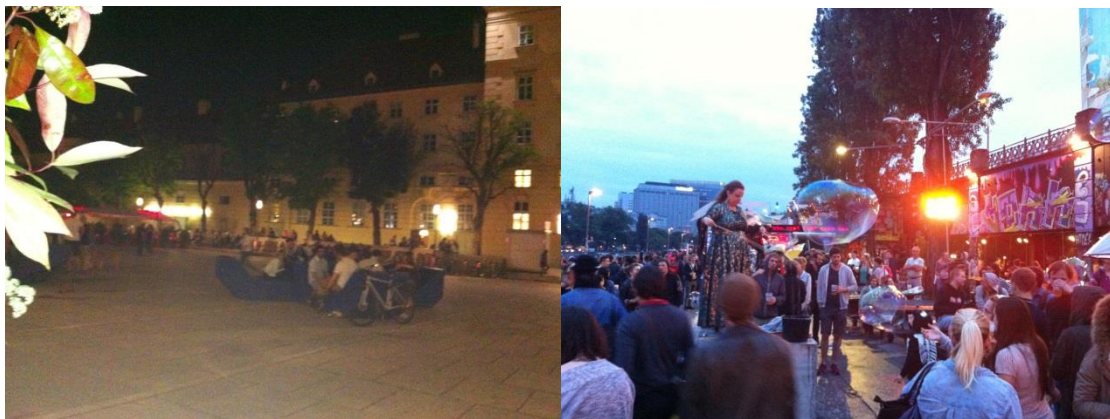
MuseumsQuartier och Donau kanal

Vi bodde i distrikt 10, som ligger i södra delen av Wien, med BOKU i andra änden av staden. Lägenheten låg dock mycket nära tunnelbanan, och har man närhet till en tunnelbana så har man närhet till det mesta i Wien! Att ta sig till skolan tog ca 20-40 minuter beroende på vilket campus man skulle till. Jag var positivt överraskad av hur smidigt det var att ta sig runt i staden och vad lugn och trygg denna storstad kändes! Wien har också många fina ställen där man kan umgås med sina vänner, MuseumsQuartier (MQ) var en av mina favoriter samt Donau kanal med alla sina barer och restauranger. Inte att förglömma Tüwi, en lokal vid ett av BOKUs campus med lunchservering och olika välgörenhetsevent hålls. Det Wien jag fått se under dessa fem månader visar på en öppenhet, en medmänsklighet och en alternativ livsstil – något som verkligen tilltalar mig! Detta var också vad jag såg framför mig och något som lockade när jag bestämde mig för att ansöka om stipendiet.