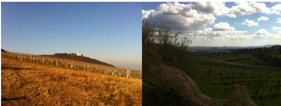
Vingårdar vid Kahlenberg

Som agronomstudent är man väl lite nördig vad gäller odling. Vingårdarna runt omkring Wien är något som gjorde mig mycket exalterad, liksom att kunna köpa Österrikiskt vin i affären. Några besök på de traditionella vinkällorna som finns omkring stan (så kallade Heuringens) hann det också bli.