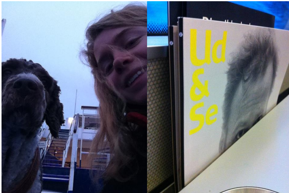
Påväg söder ut!

Att åka utomlands med hund kräver viss planering med vaccinationer, pass och planera resväg. Att hitta bostad var inte heller det lättaste men med en väldig rullians på bostäder i Wien kändes det aldrig omöjligt, varje dag kom det upp ett tiotal nya bostäder på hemsidan wg-gesucht. Tillslut fick jag äntligen tag i en lägenhet och två veckor senare lämnade jag och Bacchus, med varsina pass, ett Interrail kort, munkorg och lite för mycket packning, ett grått och slaskigt Sverige - resan söderut hade börjat!