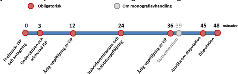
Figur 2. Tidslinje som illustrerar de obligatoriska stegen

Planering och uppföljning innehåller några obligatoriska steg (figur 2), och ska dokumenteras med hjälp av den individuella studieplanen.